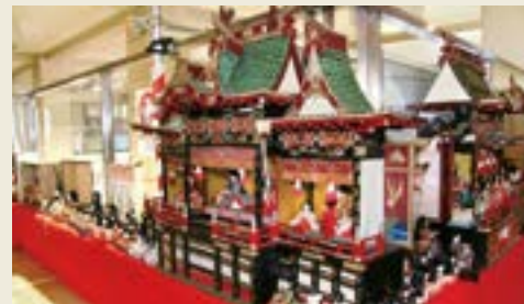
市役所「御殿飾り」(2007年)