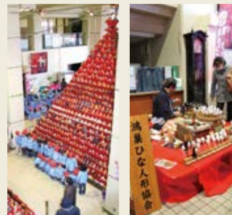
市役所「園児訪問」(左) 人形制作実演(右) (2011年)