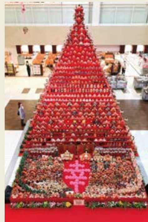
ピラミッドひな壇「幸」(2020年)