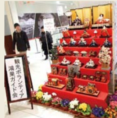
ガイド会ブース(上) ペットボトルひな壇(中) ひな壇アマビエ(下) (2019)