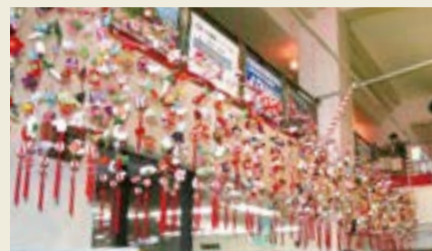
市役所「つるしひな」(2008年)