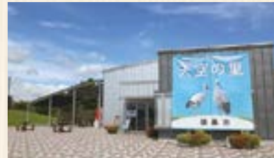
鴻巣市コウトリ野生復帰センター 天空の里