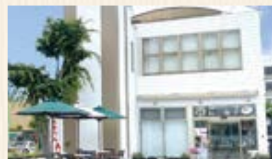
鴻巣市にぎわい交流館 にこのす