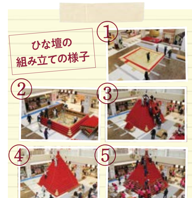
ひな壇の 組み立ての様子