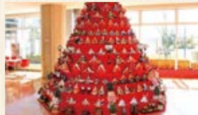
コスモスアリーナふきあげ