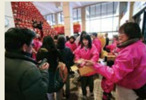
市役所「物産展」 市役所「ひなあられ配布」 (2013年)