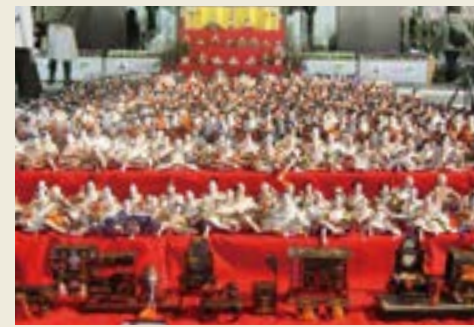
「川幅飾り&竹ひな」 (2009年)