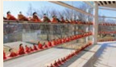
鴻巣市文化センター クレアこうのす