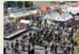
パーキングバザール (2006年)