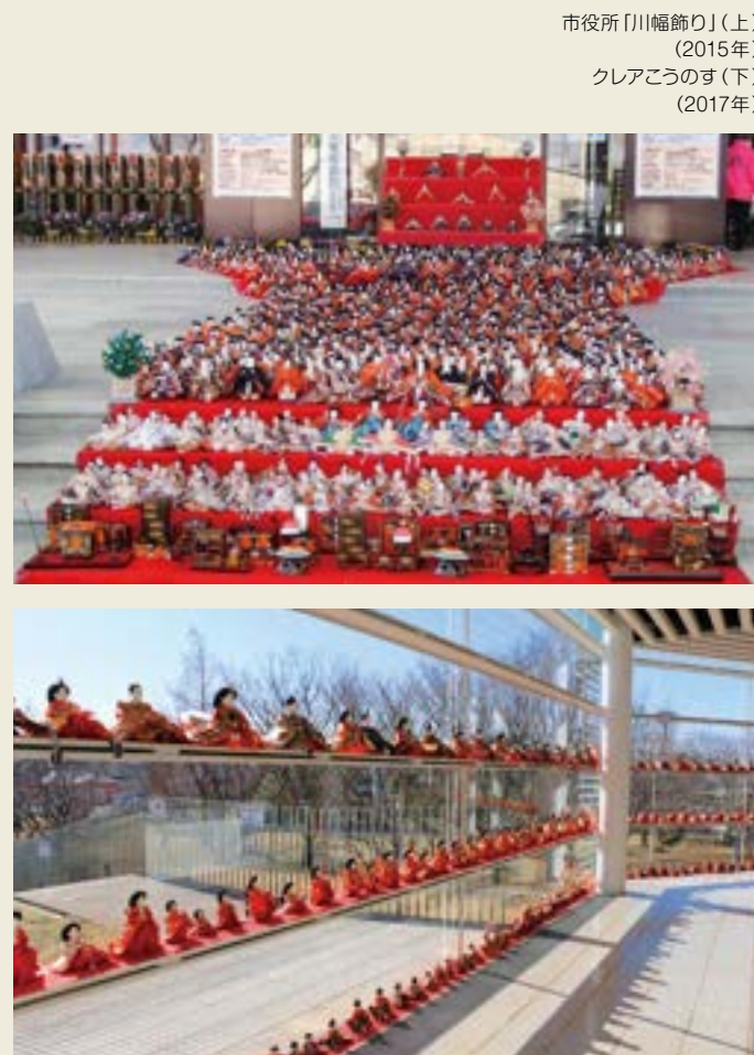
市役所「川幅飾り」(上) (2015年) クリアこうのす(下) (2017年)