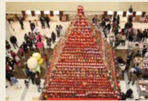
エルミこうのす「特産品販売」 (2017年)