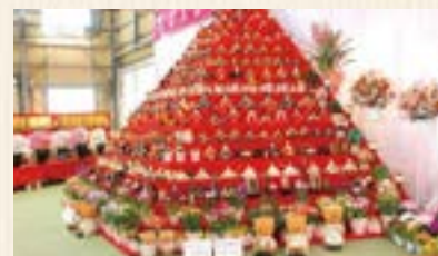
鴻巣農産物直売所 パンジーハウス