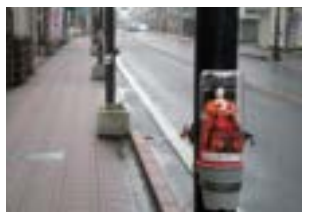
「中山道ひなめぐり」の 「ペットボトルひな」(2013年)