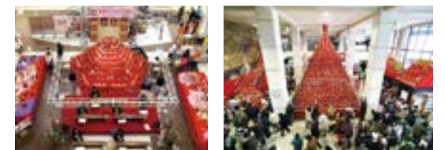
エルミ「五角錐」(左) 市役所(右)(2011年)