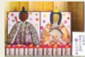
鴻巣女子高校生徒作品 (2009年)