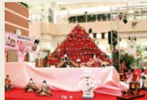
エルミここのす(2010年)