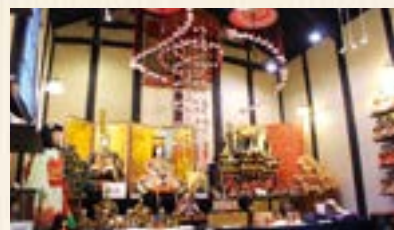
鴻巣市産業観光館 ひなの里